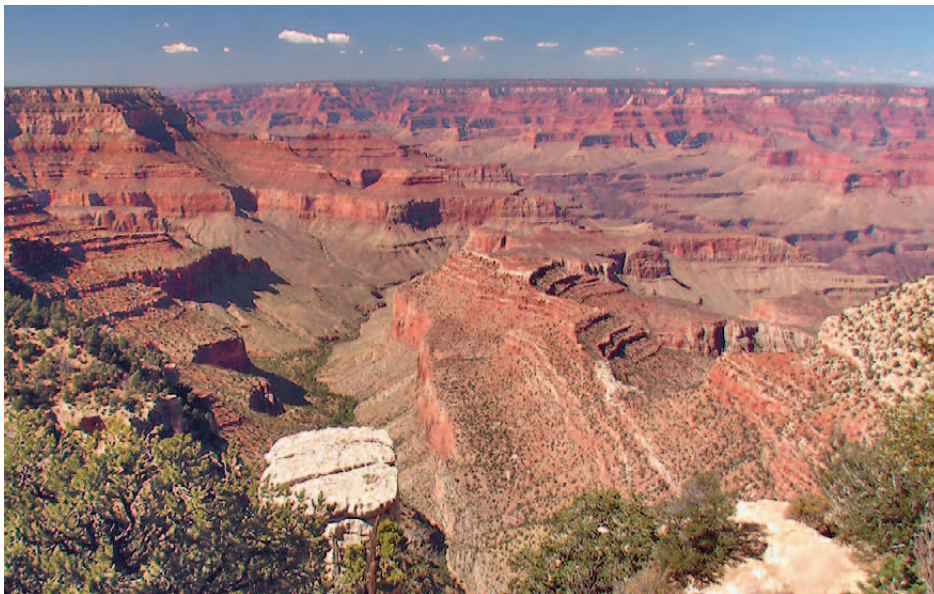
Grand Canyon