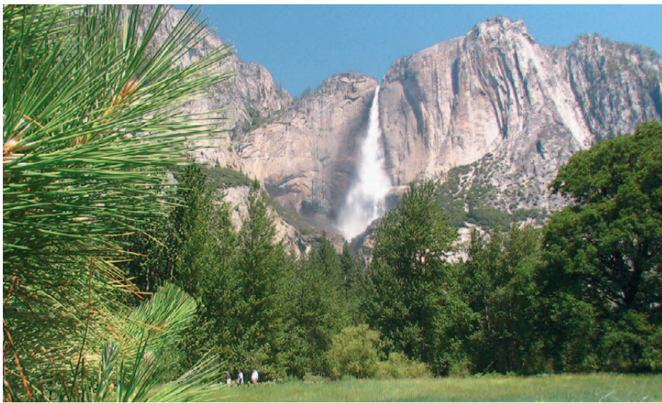
Yosemite Falls im gleichnamigen Nationalpark

Eingang des Yosemite Nationalparks, Hotel Best Western Plus.