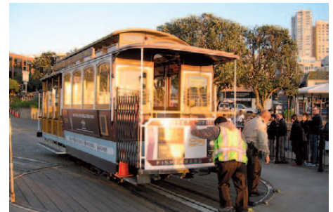
Cable Car in San Francisco

Sie verlassen Las Vegas und fahren durch die Mojave Wüste. Vorbei an zahlreichen Joshua Tree Bäumen überqueren Sie die südliche Sierra Nevada. Übernachtung in Oakhurst, unmittelbar am