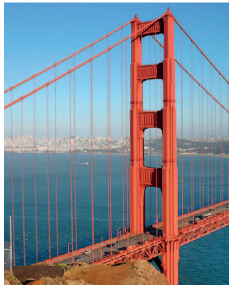
Golden Gate Brücke

Sie haben die Möglichkeit, Ihren Aufenthalt im Holiday Inn Golden Gateway um 2 Tage zu verlängern um die Stadt noch etwas länger zu genießen. Der Rückflug erfolgt dann am Montag ab Flughafen San Francisco.